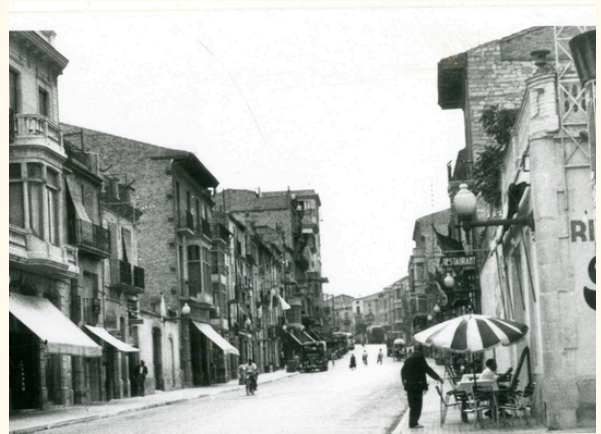
Hi ha persones exiliades que també formen part de la nostra memòria.

Per això la desmemòria es pot veure com una mancança, però també com una oportunitat per evitar els mecanismes històrics que han silenciat aquestes històries i vides. Alhora, també es pot veure com una oportunitat de generar consciència crítica per crear espais de reconeixement propis del territori.