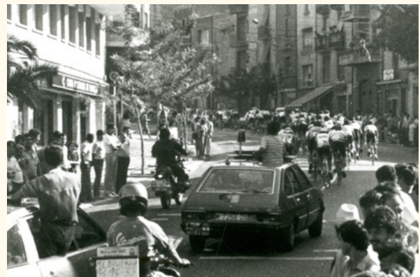
Allò que va ser censurat també forma part de la nostra ciutat.